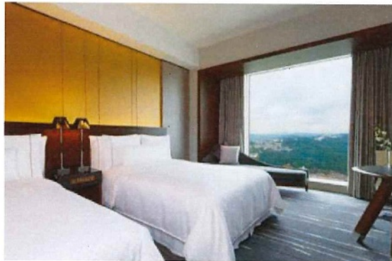
スーペリアルーム