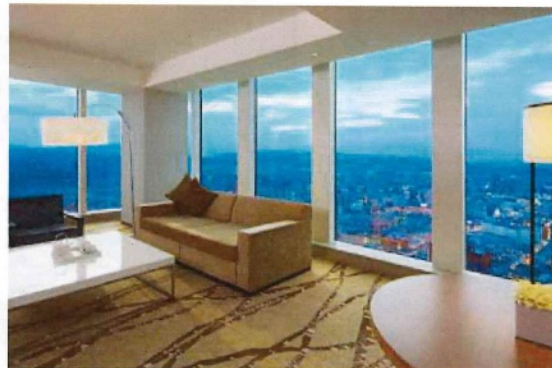
デラックスコーナースイートルーム