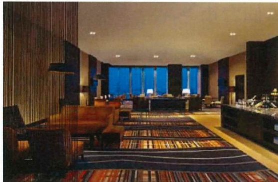
エグゼクティブ クラブ ラウンジ (26階)