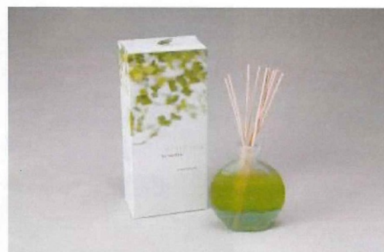
ギフトショップ (26階)