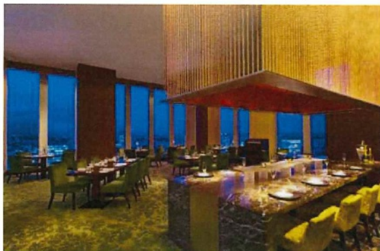
レストラン「シンフォニー」(26階)