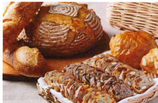
ペストリーショップ (1階)