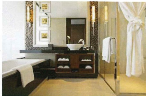
スーペリアルーム(バスルーム)