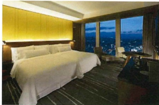
プレミアムルーム