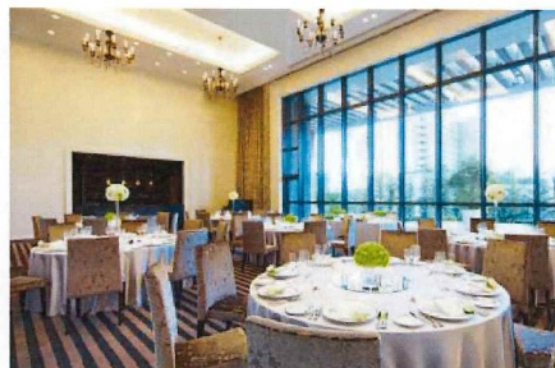
エルミタージュ(3階)