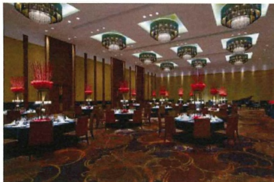
グランドボールルーム(2階)