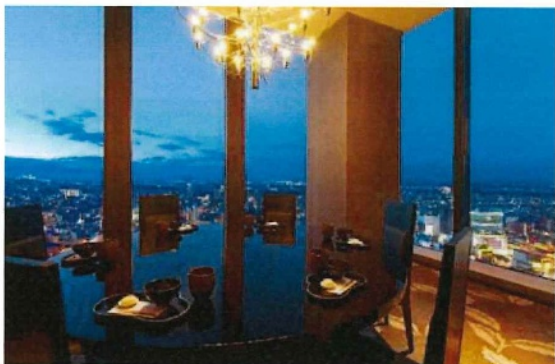
日本料理レストラン「一舞庵」(37階)