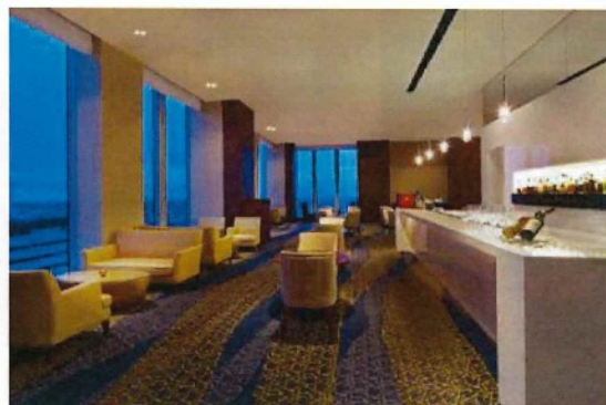
ラウンジ&バー「ホライゾン」(26階)