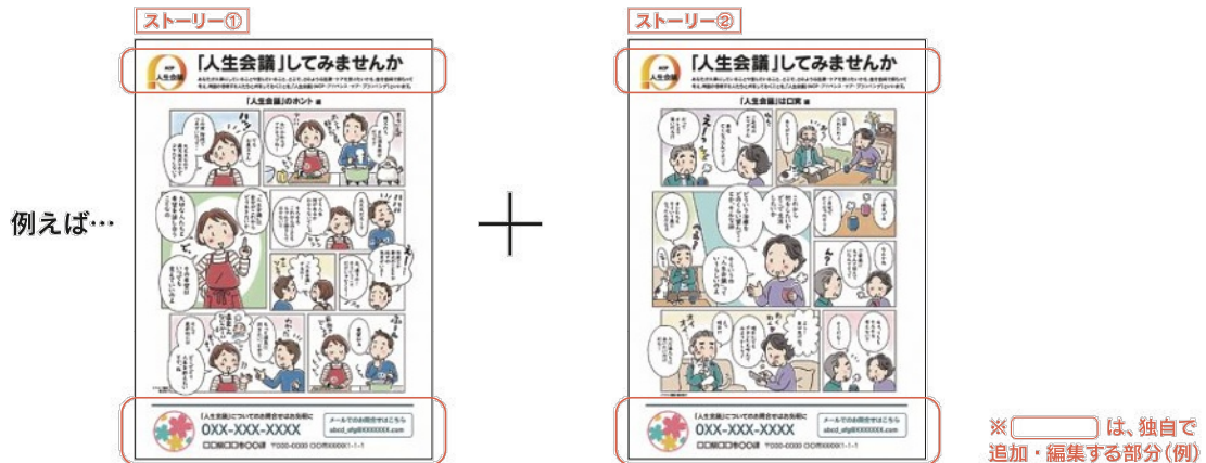
元の資料[pdfデータ]に編集を加えたオリジナルポスター(例)