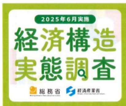
300 × 250 px